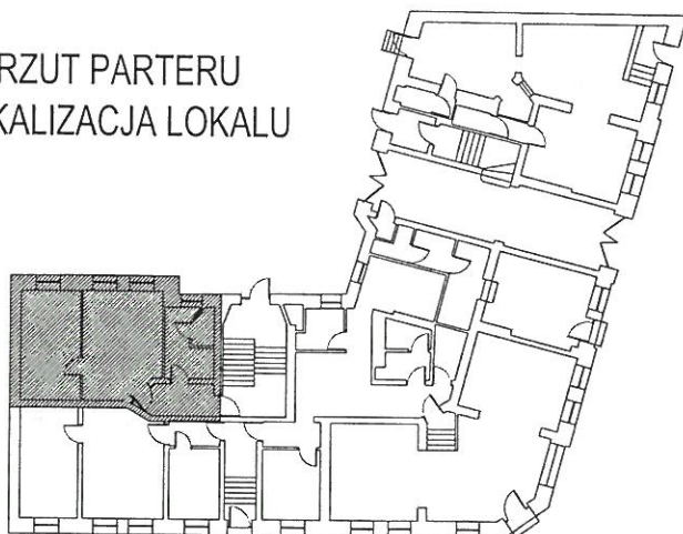
RZUT PARTERU LOKALIZACJA LOKALU